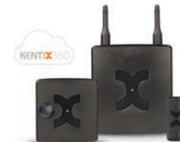
AlarmManager, MultiSensor-LAN und MultiSensor-DOOR

Die genial einfache Kentix MultiSensor® Technologie erkennt bis zu 37 physische Gefahren mit nur einem System.