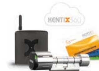
AccessManager, Online Türknäuf und Masterkartensatz

Mit einem Online Türöffner ① und einem AccessManager ② lässt sich ohne großen Montageaufwand eine komplette, fernsteuerbare Schließlösung aufbauen.